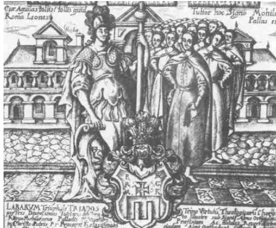
Київська академія. Мідьорит І. Щирського. 1697-1702

Михайло Воронцов, шталмейстер Петро Сумароков. Серед придворних були камергери, камер-юнкери, статс-дами, архієпископи Крутицький (Платон Малиновський) та Переяславський (Арсеній Могілянський), гофмедики, крім них - бандурист, співаки, басисти, тенориста, музиканти, кондитер з «конфетними учнями», вісім пажів, шість камер-лакеїв, 21 лакей, 10 гайдуків, чотири скороходи, а всього - 230 осіб. Загалом імператорський поїзд складався з 447 повозок та 1020 коней. За фаворитом та потаємним чоловіком государині Олексієм Розумовським було закріплено 18 коней, а за Мініхом та Воронцовим лише по шість за кожним 4 .