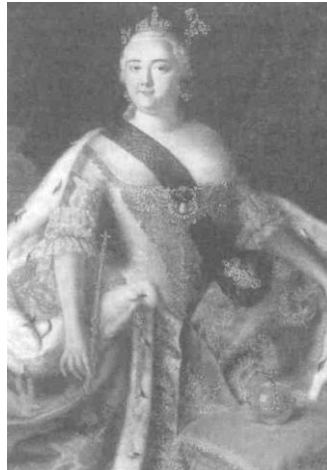
Імператриця Єлизавета Петрівна

Палац та парк над Дніпром, які носять ім'я Маріїнських, могли б називатися інакше - Єлизаветинськими. Це було б справедливо, адже їхній появі передував приїзд до Києва у 1744 році государині імператриці Єлизавети Петрівни. Саме вона повеліла побудувати у виноградному саду Царський палац, а також 9 вересня власноручно заклала церкву в пам'ять святого апостола Андрія Первозваного, призначивши її придворною при майбутньому палаці.