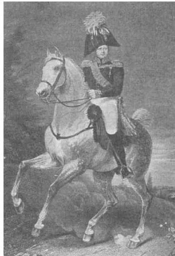
Імператор Олександр I.

а ще менше їх прикрашати». Імператриця, довідавшись про таку відповідь, сказала: «Він правий. Нехай Румянцев продовжує брати міста, а моя справа буде їх будувати» 7 .