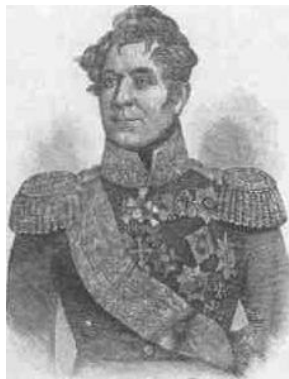
Генерал від інфантерії М.А. Милорадович

Справа ж полягала у тому, що насправді цим гостем мав бути Людовік XVIII - молодший брат короля Франції Людовіка XVI. До французької революції, під час царювання брата, він носив титул графа Прованського, а потім, в еміграції, став графом де Ліллем. У червні 1791 року одночасно з братом втік за кордон і, на відміну від нього, страченого на ешафоті, вдало. З тих пір переможна хода революційних військ примушувала його переїздити з міста до міста, з країни до країни - усе подалі на схід. Він жив у Брюсселі (Бельгія), у Кобленці (Німеччина), у Вероні (Північна Італія), у Бланкенбурзі (Німеччина), у Митаві (Курляндія) 14 , у Варшаві (Польща), знову у Митаві. Вперше Росія прийняла його у 1797 році і видалила у 1801-му, знову прийняла у 1805 році і відмовила у 1807-му. Після цього Людовік XVIII недовго мешкав у Швеції, потім придбав замок в Англії, а 1814 року королем повернувся до Франції.