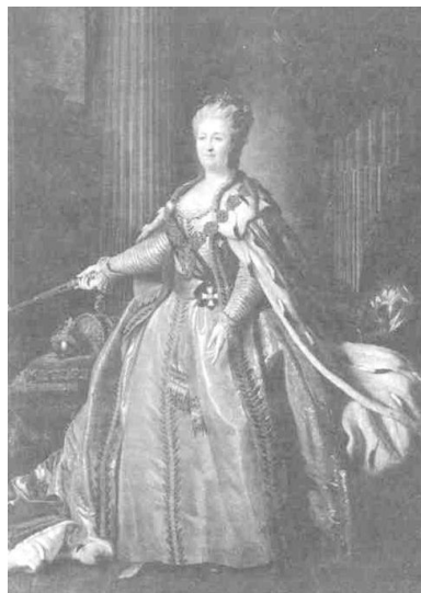
Імператриця Катерина II.

Дуже цікавим є поданий істориком Володимиром Щербинюю вміщений у камер - фур'єрському журналі опис мосту, яким Єлизавета Петрівна дісталася до Києва: «Для проходження вищезазначеного пошту через Дніпро зроблений був на протязі 450 сажнів великий дерев'яний міст, у якому ані суден, ані заліза, ані канатів та ніякого іншого укріплення, окрім самого дерева та мотузок, сплєтених з тонких лозин, ніде застосовано не було, і який при цьому був таким твердим та щільним, що хоч під час проходження увесь він на зазначеній великій довжині та при надзвичайній швидкості ріки, від одного кінця до іншого кінцями, людьми та візками покритий був, одначе не тільки ніякого ушкодження йому від того не сталося, але й вогкості ніякої на ньому видно не було».