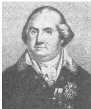
Король Франції Людовік XVIII

За 30 років - між Катериною II Великою та Олександром I Благословенним - у Царському палаці, який також іменувався Государевим та Державним і який, починаючи від Румянцева-Задунайського, займали генерал-губернатори, траплялося різне. Один з флігелів у 1790-і роки був навіть пристосований для театральних вистав, але відбувалися вони нечасто.