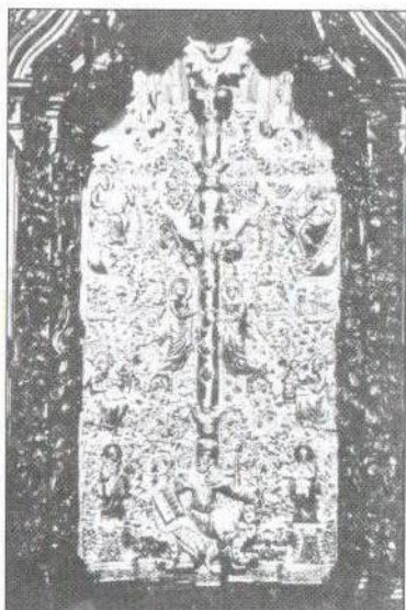
Иконостас XVIII в. в Софии. Почтовая карточка 1918 г.