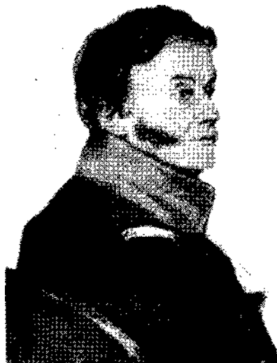
Н. Н. Раевский-старший. П. Ф. Соколов. 1826 г. Акварель.