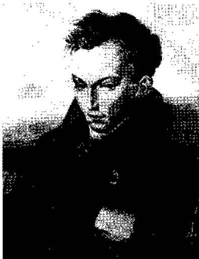
В. А. Жуковский. А. А. Флоров. 1817 г. Гравюра с оригинала П. Ф. Соколова.