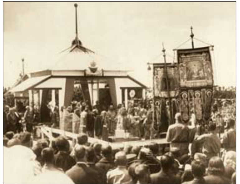
Торжественная закладка храма-памятника Николая Чудотворца