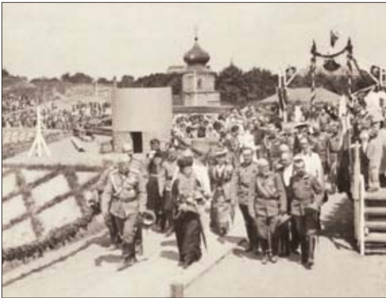
Императрица Мария Федоровна направляется к месту закладки храма

И вот в 1915 г. на Зверинце было открыто Братское кладбище — для захоронения убитых на фронтах Первой мировой войны и умерших от ран в госпитале. Оно располагалось на склоне отдельными террасами, с которых открывался широкий вид на Днепр и Заднепровье. 12 июня 1916 г. здесь состоялась закладка храма-памятника погибшим участникам войны. Газета «Киевская мысль» писала, что инициатором застрой-