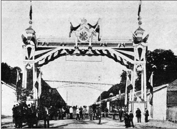
Вход на конскую выставку

Здесь были отображены главные вопросы средств передвижения, которые являются решающим условием развития производительных сил любой страны.