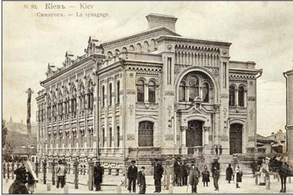
Синагога. Почтовая открытка. 1900-е