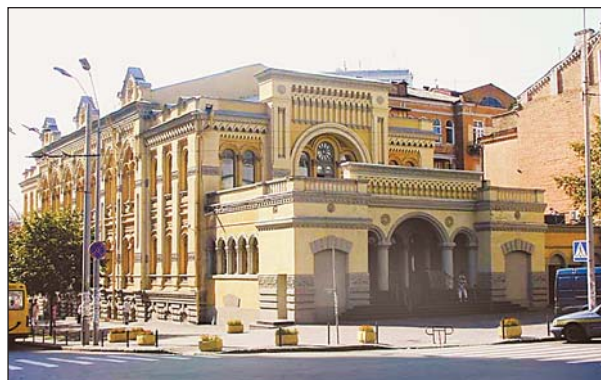
Синагога. Современный вид

Бродский также завещал городу 500 тыс. руб. на строительство Бессарабского крытого рынка. При этом он оговорил, что 22,5 тыс.