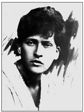
Ф. Е. Ростова-Щорс. 1918 г.