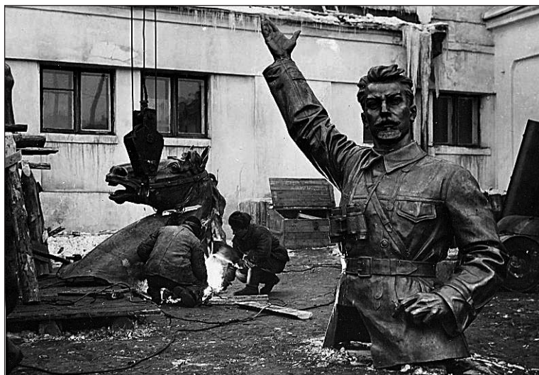
Изготовление бронзового памятника