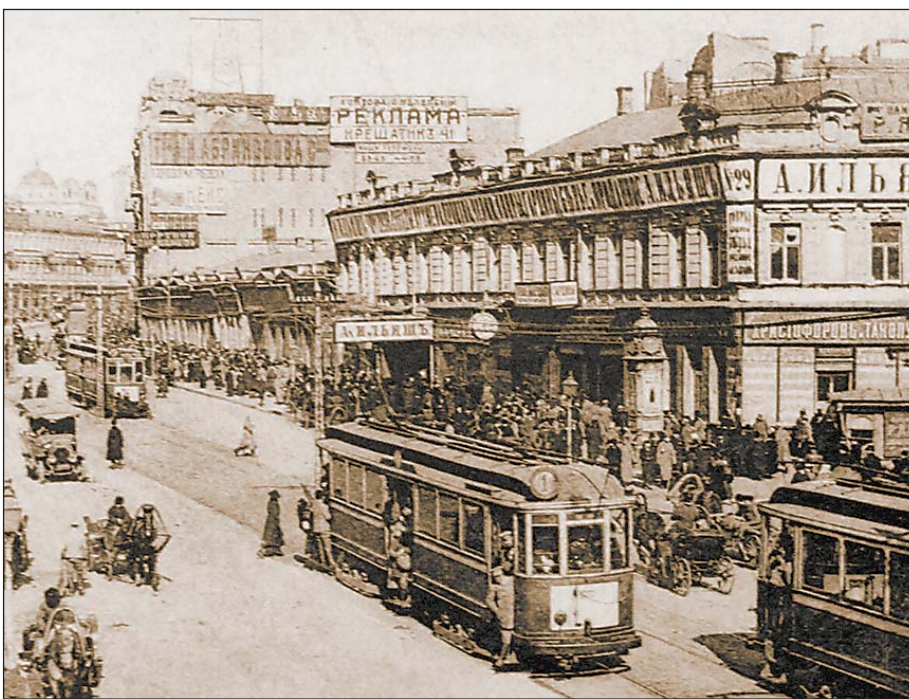
Угол Крещатики и Лютеранской, 29/1. 1910-е

Больше им встретиться не довелось: Михаил Старицкий умер в апреле 1904 г. на 65 году жизни, Михаил Чигорин — в январе 1908 г. на 58-ом. Их именами названы киевские улицы на Куреневке и Печерске.