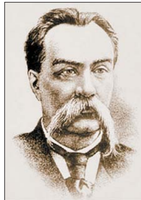
М. П. Старицкий (1840—1904)

Киевские газеты и путеводители по городу неоднократно размещали рекламные объявления, пригласив посетителей сюда на чашку кофе и не только. Например