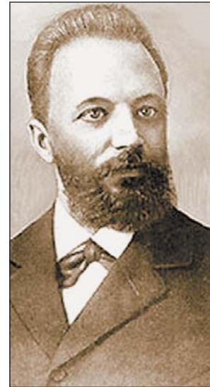
М. И. Чигорин (1850—1908)

Этот сюрприз заключался в том, что в одной из комнат кофейни посетители ожидали несколько шахматных столиков с расставлен-