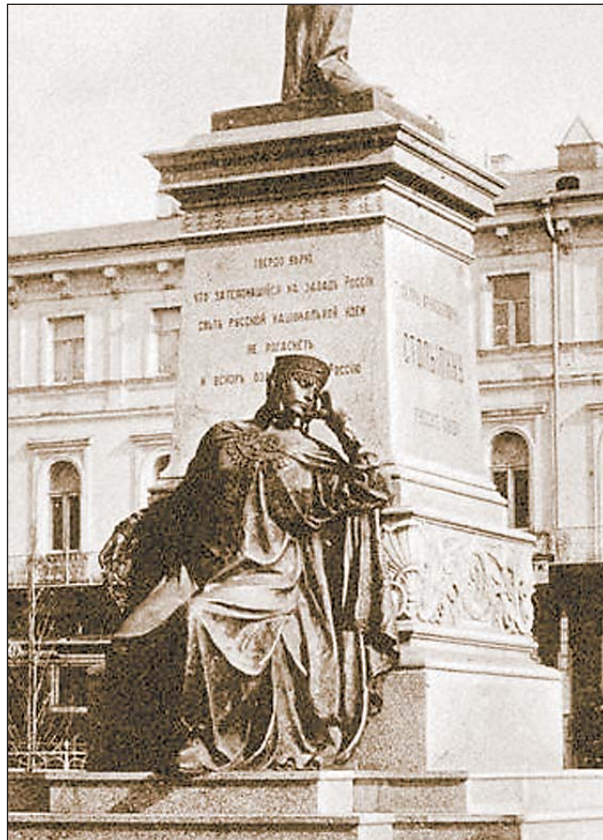
Женская фигура на постаменте памятника Столыпину. 1913

Воспитанное на однобоком освещении истории, советское общество со школьной парты усваивало, что была «стольпинская реакция», был закон о военно-полевых судах, но никто не хотел знать, что за неделю до его принятия, 12 августа 1906 г., на даче Столыпина в Петербурге взрывались эсерские бомбы, от которых погибли около 30 человек и столько же ранены, и среди них малолетний сын и дочь Столыпина. Это был террор в ответ на принятие новых законов, и реформатор противопоставил насилию силу реформ.