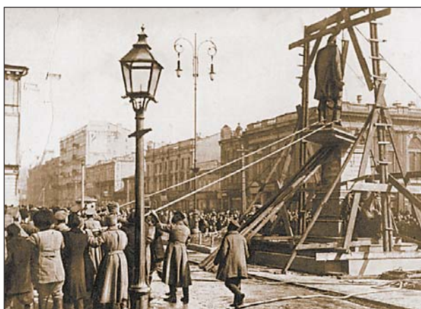
«Казнь» Столыпина. 16 марта 1917

Городская дума постановила переименовать Мало-Владимирскую улицу в Столыпинскую (в 1919 г. она стала улицей Гершуни, в 1937-м — Кецохели, в 1939-м — Чкалова, в 1996-м — О. Гончара) и установить в сквере у Городского театра памятник. Однако семья покойного не согласилась с этим предложением и отдала предпочтение Крещатикской площади — перед зданием городской думы. 5 сентября 1912 г.,