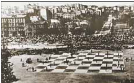
«Живые шахматы» на Красном стадионе, 1925 г.