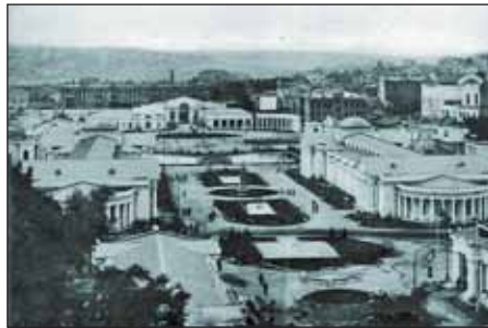
Вид выставки 1913 г. с верхних террас