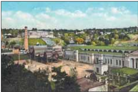
Общий вид выставки 1913 г.