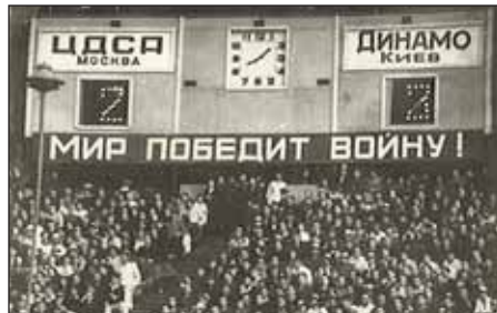
Матч «Динамо» (Киев) — ЦДКА (Москва)

менной площади перед стадионом и до его чаши) расположились павильоны торгово-промышленный, кооперативный, машиностроения и электротехники, строительства и химической промышленности, полиграфии и издательств, автомобильный, транспортный, несколько частных павильонов. Здесь также были бассейн с подсвечиваемым разными цветами фонтаном, ресторан, эстрада для оркестра, прочие увеселения, а парадная лестница вела к стоящему на возвышенности павильону земств.