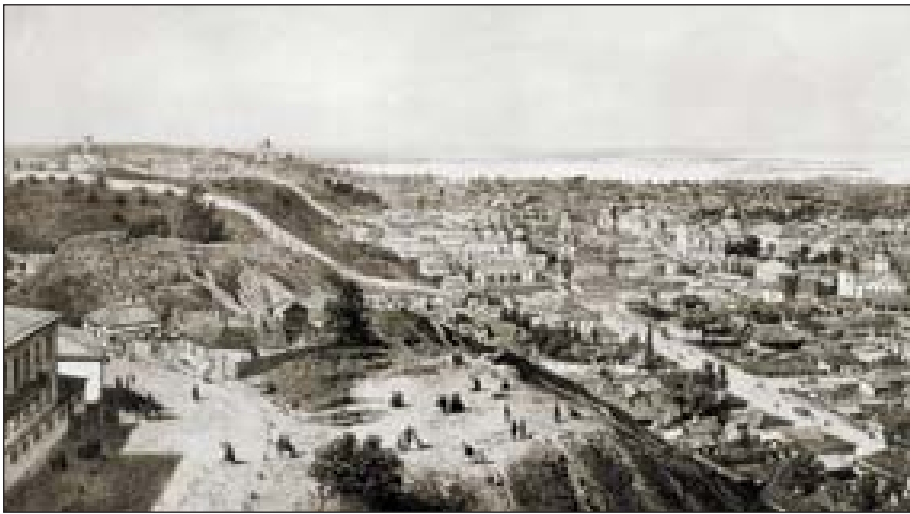
Вид на Подол. 1862 г.

В 1811 г. Подол, а с ним и Флоровский монастырь вновь подверглись небывалому пожару. Проповедник протоиерей Иоанн Леван-