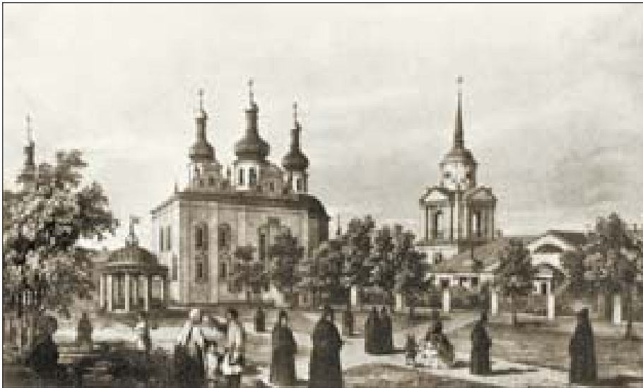
Вознесенская церковь Флоровского монастыря. Рис. В. Барвитова. Первая половина XIX ст.

да писал об этом одной из своих почитательниц: «Вы очень помните прекрасный город наш Киев, Подол, но теперь его нет. Он уже не существует. 9 июля истребил его страшный пожар, не щадя в нем ничего при засухе, ветре и пламенном вихре. Церкви, монастыри, дома пали в огне и пепле. В городе осталась одна пречистенская базарная церковь, да за каналом, отделяющим город от предгорья к лугам, тут две с домами приходскими уцелели. От стен каменных, что не догорело, то осталось в безобразии, поражающем сердца. Повсюду виды ужаса; но зрелище во Флоровском монастыре, после сгоревших до основания келий представившее 30 с лишком тел монахинь и послушниц, задохшихся и обгоревших, превосходило ужасы другие».