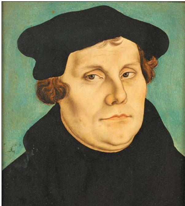
Мартин Лютер (1483—1546)

зера и прочих, имена которых произносит с благоговением, их открытия старается применить практически. Несмотря на свою тихую, уединенную жизнь, он известен своими добродетелями, ибо чуждается света, а не людей».