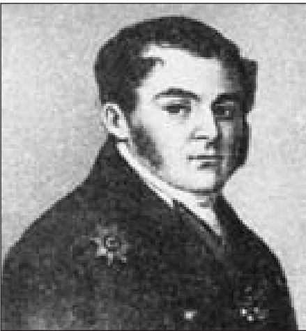
Д. Г. Биби́ков (1792—1870)