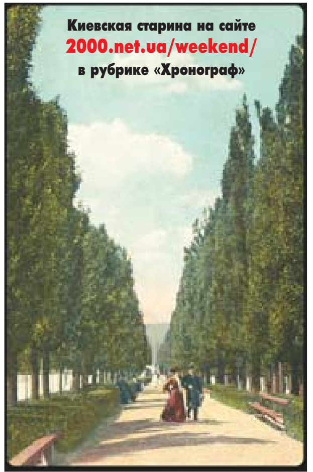
Биби́ковский бульвар. 1900-е

Под контролем Биби́кова было выполнено ранее разработанное генеральное плана Киева и Киево-Подолы, переустройство Крещатики и прокладка новых широких улиц, обделка в 1849 г. Александровской горы, строительство Николаевского цепного моста , начатое в 1848-м и за-