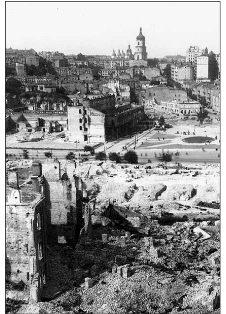
Крещатик. 1943 г.