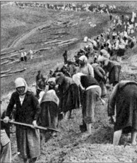
Рытье притивотанковых окопов. 1941 г.

3 ноября 1943 г. советское командование приступило к Киевской наступательной операции. В ответ, чувствуя близкий конец, оккупанты начали жечь город. В последние дни своего пребывания они сожгли красный корпус университета им. Т. Шевченко. Продолжавшаяся 778 дней немецкая оккупация завершилась 6 ноября, когда рано утром передовые части Красной армии вошли в пылающий Киев. Над городом поднялся красный флаг Победы.