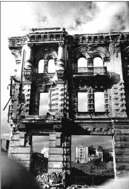
На улице К. Маркса (Архитектора Городецкого)