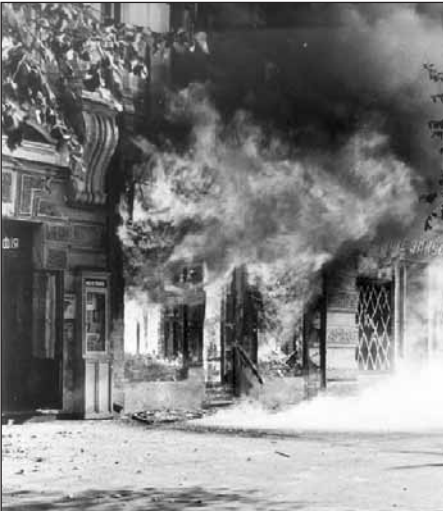
Крещатик. 24 сентября 1941 г.