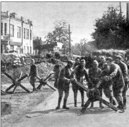
Противотанковые заграждения. 1941 г.