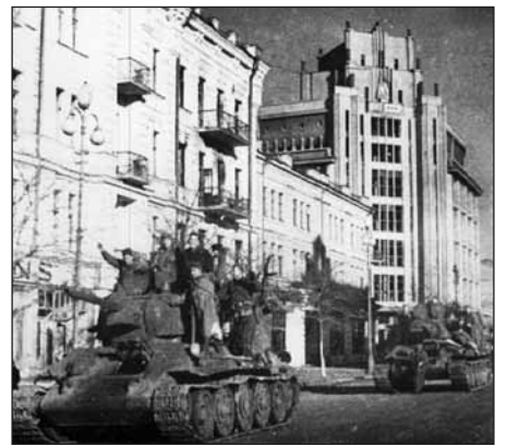
Освободители, 6 ноября 1943 г.