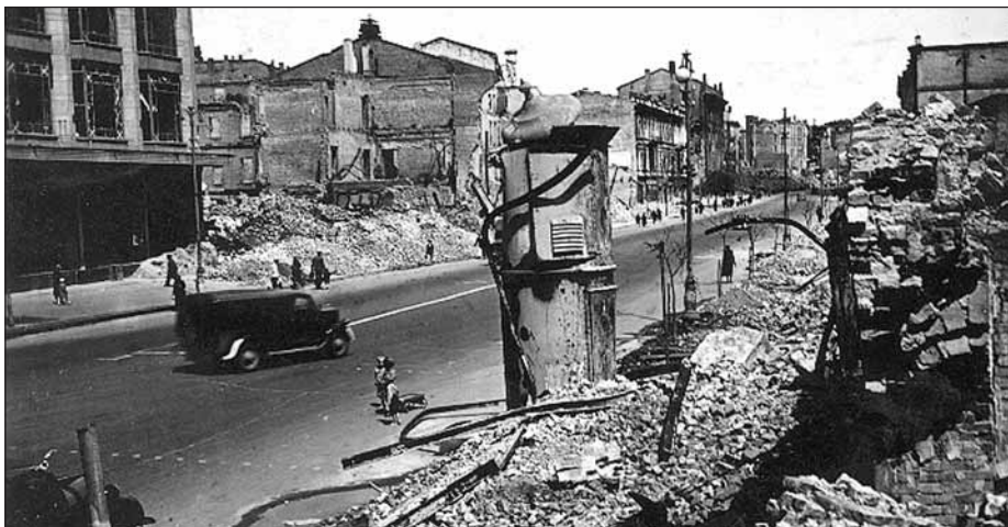
Крещатик. 1942 г.