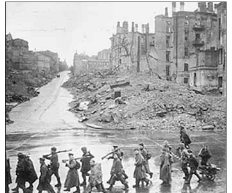
Возвращение. Крещатик, 6 ноября 1943 г.