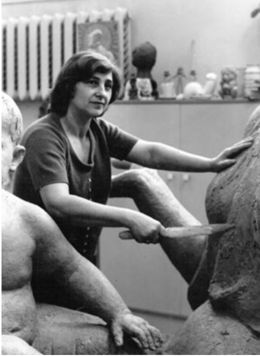
Юлія Скоблікова за роботою. 1970-ті рр.

тері вийшов дуже цікавий. Завдяки, можна сказати, імпресіоністичному ліпленню в ньому відчувається внутрішня напруга жінки, що пережила смерть двох своїх дітей.