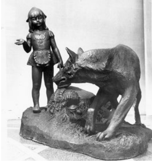
Червона Шапочка. 1973. Бронза

Ю. Скоблікова, як неординарна творча особистість, часто приділяла увагу різним цікавим нюансам або вирішенню певних деталей у своїх творах, перетворюючи їх на несподіванки. Серед таких робіт можна виділити прекрасне погруддя великого композитора Бетховена, яке було створено у парі з портретом Баха для Миколаївського костелу у Києві. Композитор зображений з виразним обличчям, сповненим емоцій, а його хвилясте розкуйовджене волосся додає образу цілісності. В портреті привертає увагу пишний бант, закручений у дивовижне переплетення тканини. Один відомий художник під час виставкому довго вдивлявся у твір, а потім сказав: «У тебе прекрасний портрет, а як ти цікаво закрутила цей бант!». Ю. Скоблікова розповідала, що він мав рацію, однак головного все-таки не помітив. Якщо придивитися уважно до цього банта, то в його лініях можна побачити образ Мадонни з накинутим на голову мафорієм, яка прикрила обличчя рукою.