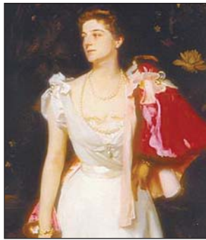
Е. П. Демидова (1853—1917)