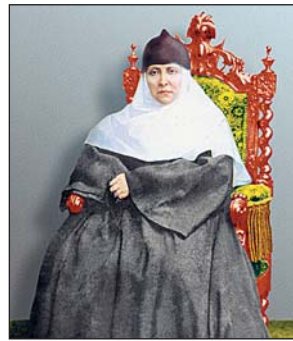
Александра Петровна (1838—1900)