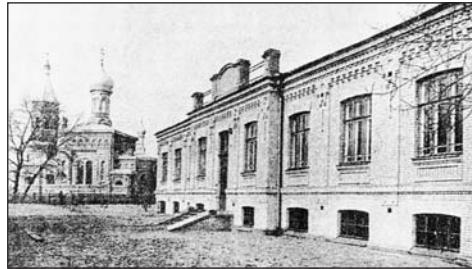
Церковь Св. Елены и школа на Трухановом острове. 1909