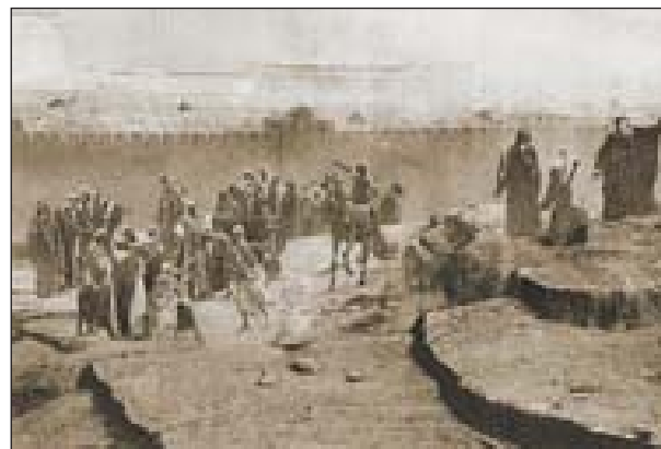
Фрагмент панорамы картины «Распятие Христа»