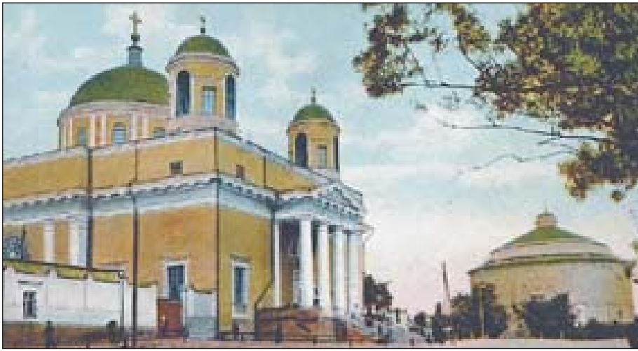
Александровский костел и панорама «Голгофа»

Это было полотно длиной 94 и шириной 13 м. Его перевезли, пред-