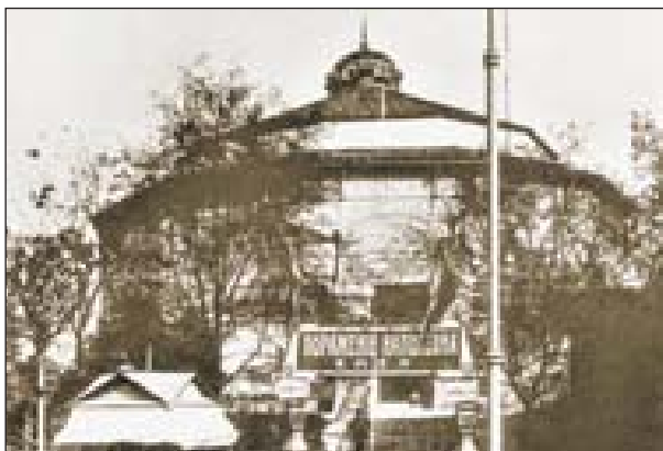
В панораме демонстрируется «Поражение Наполеона»

Пришли два сотрудника наркомпроса, самоуправно захватили картину «Распятие Христа» и выгнали владельца из «Голгофы»