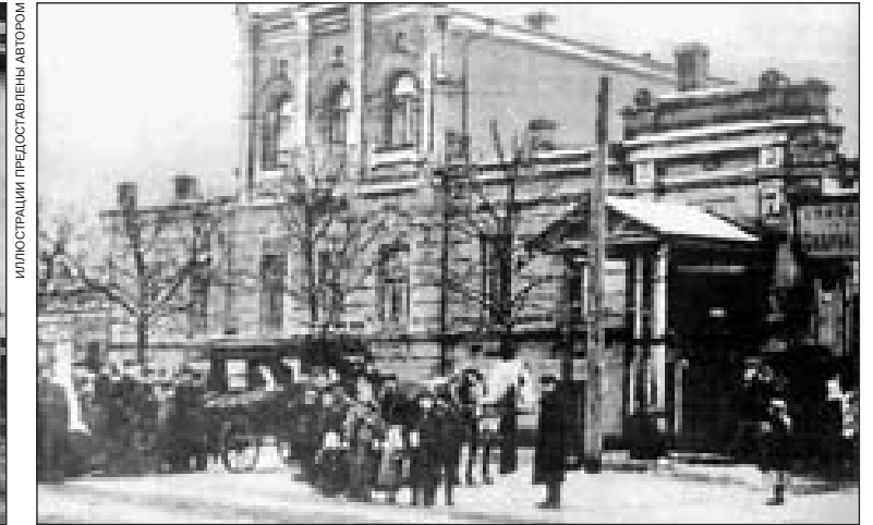
Станция скорой помощи на ул. Владимирской, 33

чае же второго выезда до момента возвращения первого врача на место происшествия отправляется заведующий. По получении вызова персонал очередной кареты собирается у подъезда, выходит врач и спустя 1—2 минуты с момента получения вызова карета выезжает на место случая. Подав пострадавшему медицинскую помощь на месте происшествия, врач Общества, если это необходимо, перевозит больного на дом или в больницу».