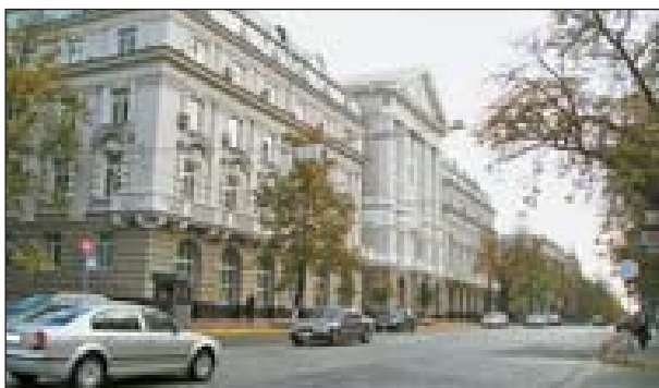
Служба безопасности Украины

Ныне городская станция скорой медицинской помощи находится по ул. Б. Хмельницкого, 37б, а на Рейтарской — городская клиническая больница № 16. На Владимирской, 33 в сентябре 1913 г. было заложено здание Киевского губернского земства. Оно сооружалось по проекту В. А. Щуко, но в связи с Первой мировой войной и последующей революцией 1917 г. в полной мере проект не был реализован. Сейчас здесь — Служба безопасности Украины.