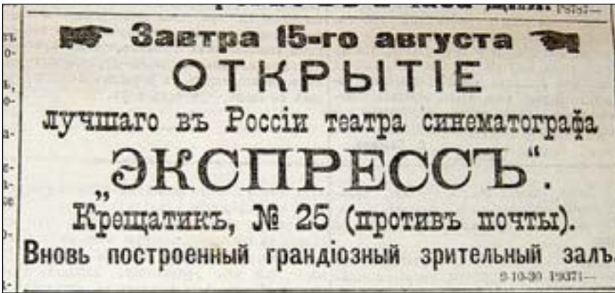
Газета «Киевлянин». 14 августа 1908 г.