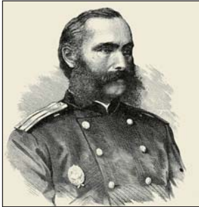
А. Е. Струве (1835—1898)

И еще: «Не беря на себя смелости высказывать личный суд о таком специальном деле, мы, однако, считаем себя вправе передать голос и людей компетентных, и всей общественности о строителе моста. Струве, по общему признанию, возвел себе в ковечный памятник этим сооруже-