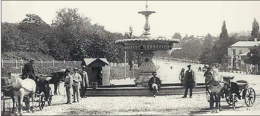
Фонтан на Европейской площади (1880)