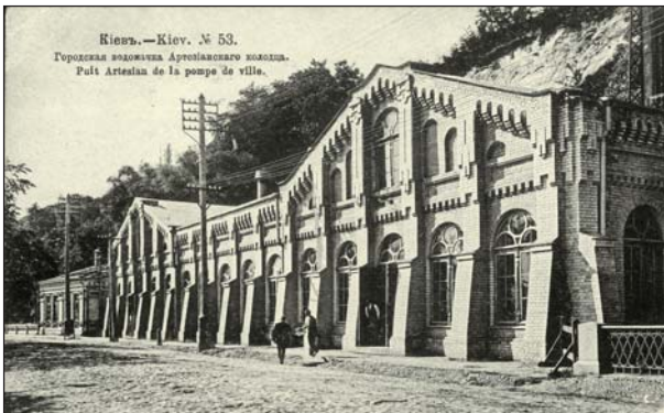
Машинное отделение водопровода на Набережном шоссе. 1906 г.

В течение первых полутора лет действия договора необходимо было проложить водопроводную сеть, установить пожарные и водоразборные краны и прочее оборудование в Дворцовой и Старокиевской частях города, то же в Лыбедской и Подольской частях — в течение двух лет и в