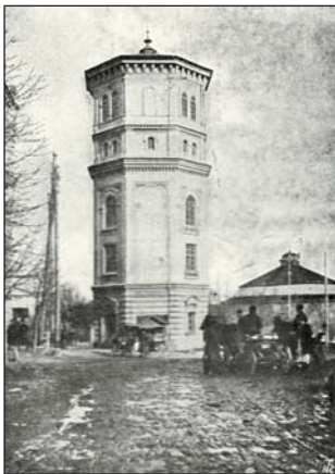
Михайловская водонапорная башня (1872)